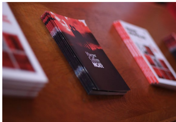
Échantillonnage catalogue Harper Collins