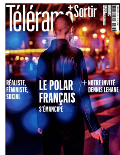
Télérama : « Dennis Lehane », 06/04/2024