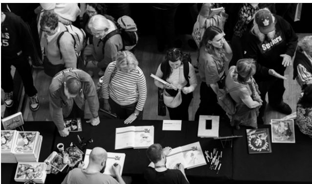
Dédicaces à la Grande Librairie - Palais de la Bourse