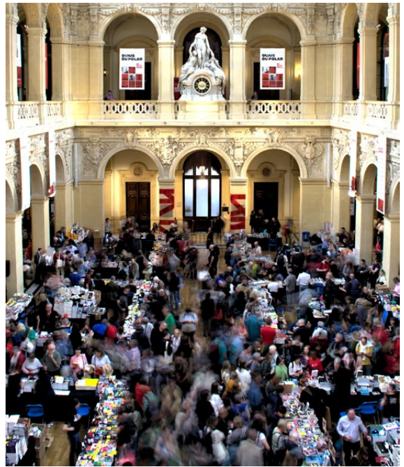
Grande Librairie du Palais de la Bourse