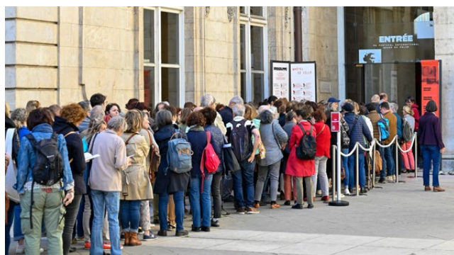
Entrée de l'Hôtel de Ville