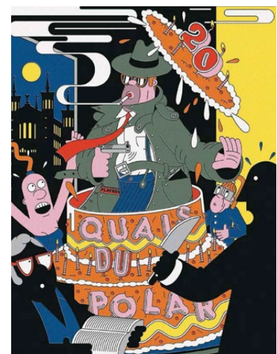
M le magazine du Monde : « La joyeuse confrérie des maîtres du polar », 20/04/2024