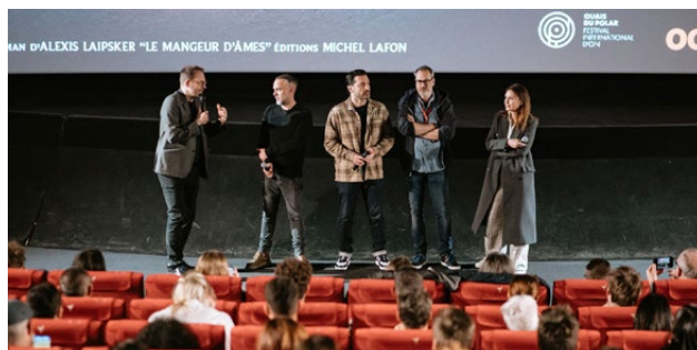
Projection du Mangeur d'âmes - Pathé Bellecour