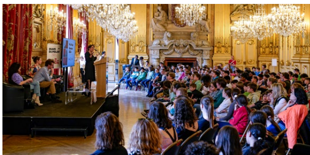
Remise du prix littéraire jeunesse - Hôtel de Ville