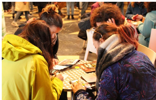
Grande Enquête de Quais du Polar

Conviez vos partenaires, client·e·s ou collaborateur·ice·s à participer à l'inoubliable Enquête organisée chaque année par Quais du Polar, sur un format réduit et adapté. Chaque participant·e se verra remettre un livret détaillant l'intrigue et les étapes du parcours. À l'arrivée, ils sont conviés à un cocktail et repartent avec un sac cadeau.