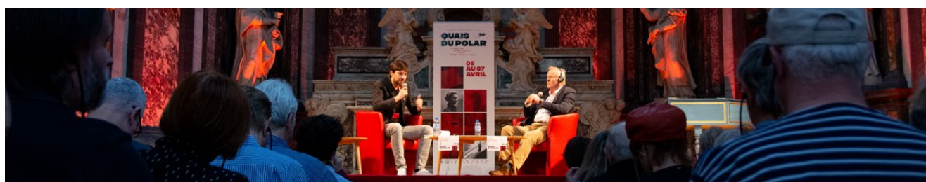
Conférence Une heure avec John Grisham - Chapelle de la Trinité

Malgré sa notoriété, le festival maintient une ambiance particulière, à la fois festive et conviviale, qui est sa marque de fabrique. Cette atmosphère est chaque année saluée par les professionnels (auteurs, éditeurs, libraires, journalistes) comme par les festivaliers et festivalières qui sont prêts à faire la queue dans la bonne humeur, parfois pendant plusieurs heures, pour assister aux différents événements. Cela tient notamment à la volonté de l'équipe et de l'association qui portent le projet avec bonne humeur et détermination, ainsi qu'à l'enthousiasme des 300 bénévoles qui, pour certains, nous accompagnent depuis de très nombreuses années.