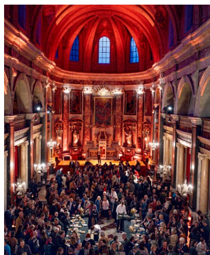
Soirée d'inauguration - Chapelle de la Trinité