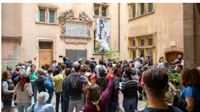
La Grande Enquête © Slowick