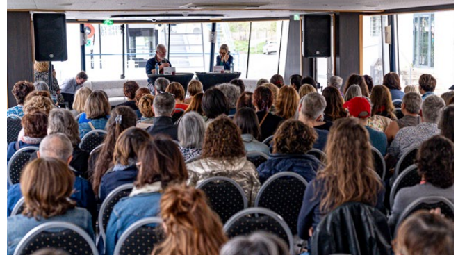
Croisière littéraire avec Peter May