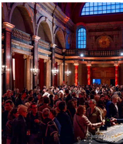
Cocktail d'inauguration