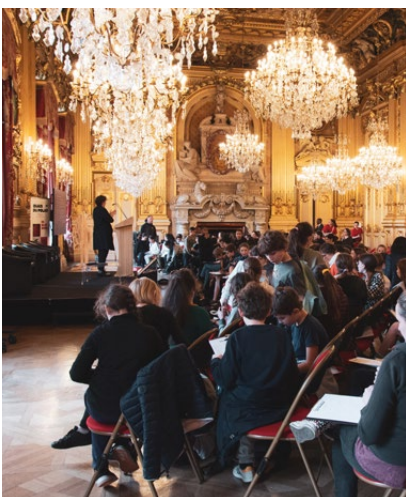
Dictée Noire scolaire - Hôtel de Ville