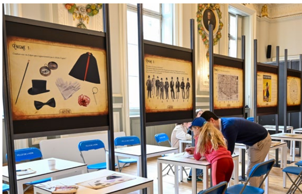
Panneaux de jeu les Arsènes, espace jeunesse

Cette proposition vise les maisons d'éditions ou éditeurs de jeux jeunesse.