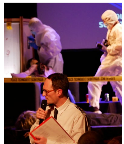
Immersion avec la Police Scientifique - Comédie Odéon