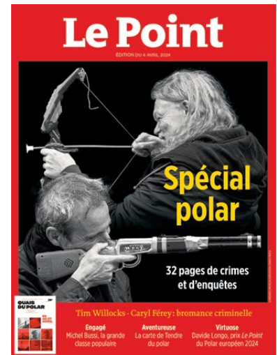
Le Point : « Spécial Polar », 04/04/2024

« Ce sont plus de 100 000 festivaliers et festivalières et plus de 20 000 participants à la Grande Enquête dans la ville qui ont pris part à Quais du Polar cette année. Est-ce le plateau des 135 autrices et auteurs de renom ? Le soleil radieux ? Ou encore la célébrations de 20 ans d'un festival devenu culte qui a motivé toutes ces personnes à se rendre au Palais de la Bourse et dans les multiples lieux partenaires ? Difficile à dire, tandis que l'équipe organisatrice du festival se réjouit de ces scores, reflétant leur labeur. » 100 000 visiteurs à Quais du Polar 2024, 08/04/2024