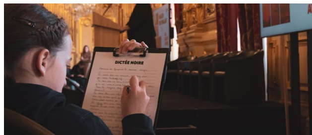
Grande Dictée Noire pour les scolaires - Hôtel de Ville