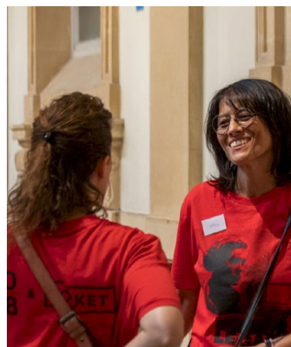
Les bénévoles