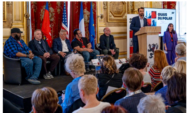
Conférence Dialogue autour de l'élection présidentielle américaine - Hôtel de Ville