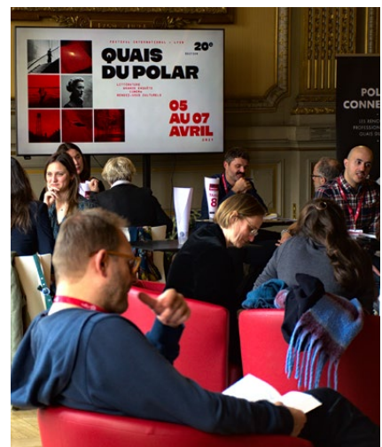
Polar Connection

Nous sommes ouverts à vos propositions concernant des partenariats de projets potentiels n'ayant pas été cités en exemple et à la création d'un partenariat sur-mesure en fonction de votre structure et de vos ressources.