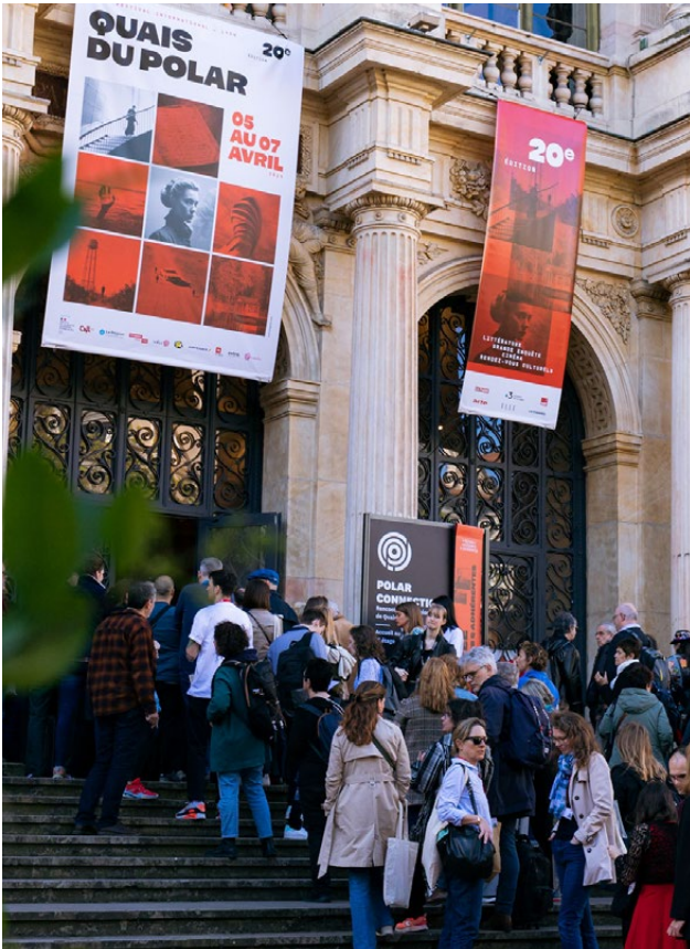
Accueil - Palais de la Bourse