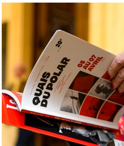
Programme festival

en tenant compte de votre spécificité et de vos centres d'intérêts pour définir les contreparties qui vous conviennent.