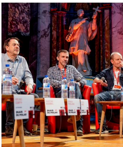
Focus sur le polar français