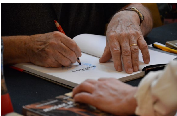
Séance de dédicaces

Nous organisons pour vous une rencontre privée avec l'un des invité·e·s francophones du festival. Vos collaborateurs·ice·s auront ainsi l'occasion d'échanger plus personnellement avec eux et repartiront avec leur dernier ouvrage dédié. Sous forme de petit-déjeuner, déjeuner ou cocktail.