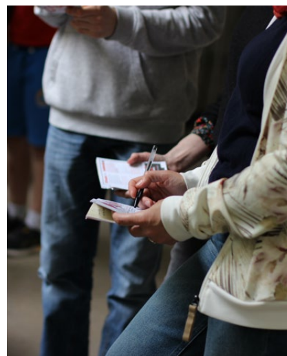
Grande enquête urbaine