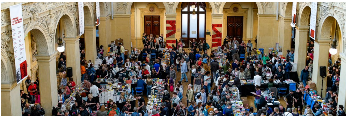
Grande Librairie du Palais de la Bourse