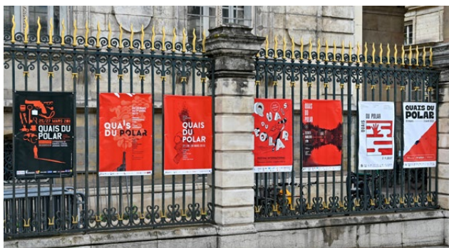
Exposition rétrospective - Hôtel de Ville