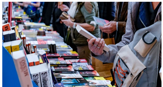
Stand librairie - Palais de la Bourse

Aujourd'hui, le festival Quais du Polar fait revivre et partager ce riche patrimoine culturel, entre Saône et Rhône, à travers un événement moderne, fédérateur et ouvert sur le monde qui s'inscrit sur le vaste territoire d'une métropole de 59 communes et de plus de 1,4 million d'habitant·e·s parmi les plus attractives d'Europe.