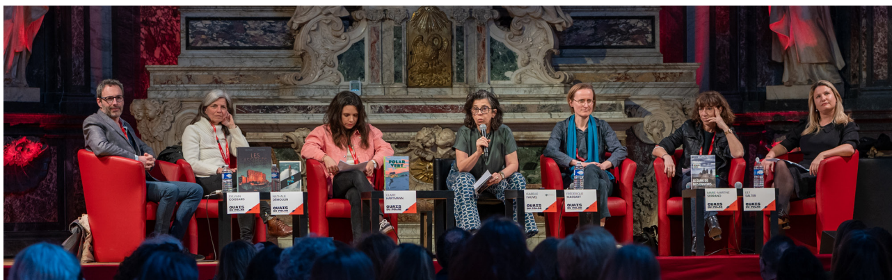
Remise des Prix 2023 - Polar en séries - Chapelle de la Trinité